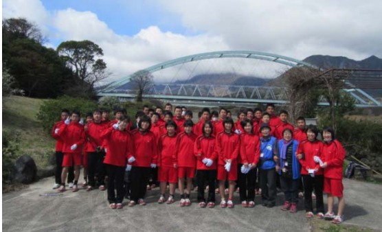
活動後、みなで満足の集合写真 =われん川、深江町(文:ジオガイド永田ゆき子さん)

4月7日(土)と8日(日)、平成30年度長崎大学環境科学部新入生合宿研修が開催されました。この研修会の中で、ジオ専門員が、ジオパークプログラムの目的やジオパークの視点で島原半島の見所を、クイズを交えて紹介しました。 また、認定ジオガイドが旧大野木場小学校被災校舎を案内し、島原半島で生じた火山災害を学びました。学生の半分以上