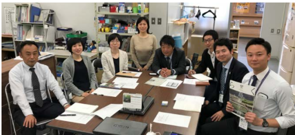
月に1回集合。メンバーは、県 自然環境課、島原鉄道(株)、(株)島原観光ビューロー、(一社)島原半島観光連盟、ジオ事務局

本年度は島原半島の日本ジオパーク認定10周年の年にあたり、県と共催で本年11月にシンポジウム開催を予定しています。