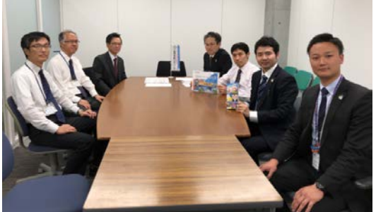
長崎県環境部へご挨拶 =新県庁、長崎市

平成29年8月、ツアーリズムワーキンググループ島原版が発足しました。これは、お客様が魅力を感じ、かつ利潤を生む企画を実施することを目的に、民間企業にも参加してもらいました。 昨年度は、民間とジオパークの意識の溝を埋める助走期間。今年度は、「さるく」や、交通機関を活用して本格的に観光に参入していきます！