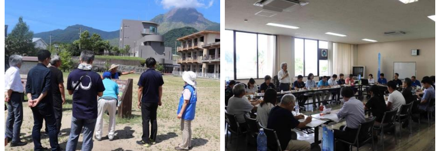
ジオガイド主導で実施されたジオツアー =旧大野木場小学校 各地域の取り組みを共有した連絡会の様子 =小浜総合支所