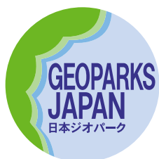
日本ジオパーク (国内14地域)