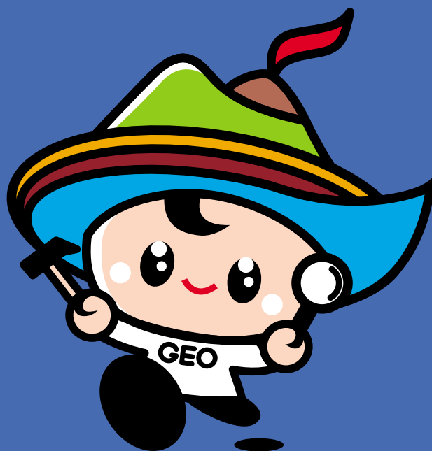
島原半島世界ジオパークキャラクター ジオくん

< 島原半島ジオパーク推進連絡協議会 > 事務局 〒855-0879 長崎県島原市平成町1-1 雲仙岳災害記念館内 TEL.0957-65-5540 FAX.0957-65-5542 メール info@unzen-geopark.jp