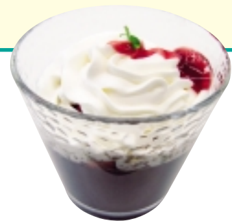
普賢岳を表現したプリン